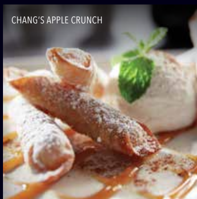
CHANG'S APPLE CRUNCH

Seis trozos de banana cubiertos con wonton crujiente, acompañados con helado de vainilla y rociados con caramelo y salsa de vainilla. Q60