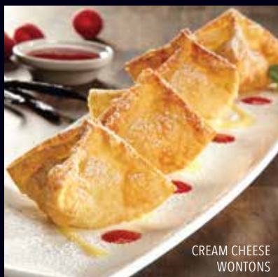
CREAM CHEESE WONTONS

Crujientes y cremosos wantones rellenos de una combinación de queso crema y vainilla. Rociados con azúcar en polvo, servidos con salsa de vainilla y frambuesa. Q50